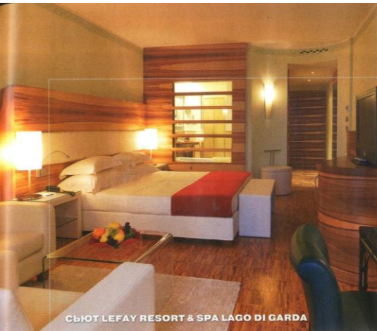
СЬЮТ LEFAY RESORT & SPA LAGO DI GARDA