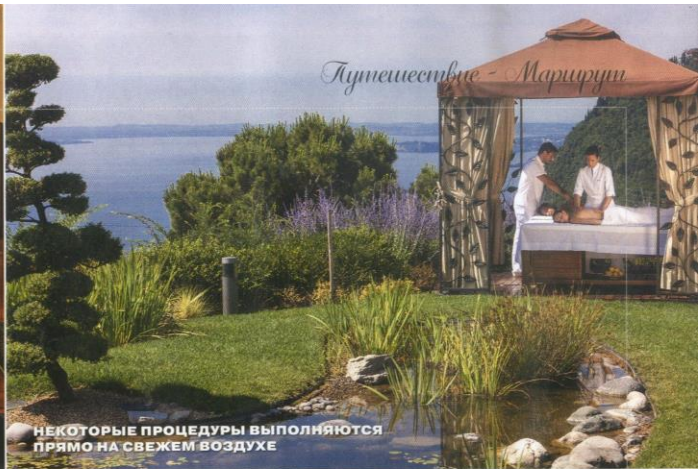
НЕКОТОРЫЕ ПРОЦЕДУРЫ ВЫПОЛНЯЮТСЯ ПРЯМО НА СВЕЖЕМ ВОЗДУХЕ