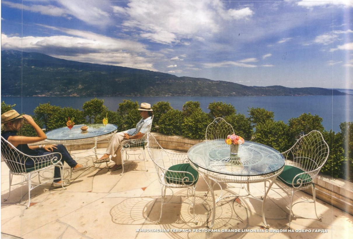
ЖИВОПИСНАЯ ТЕРРАСА РЕСТОРАНА GRANDE LIMONAIÀ С ВИДОМ НА ОЗЕРО ГАРДА