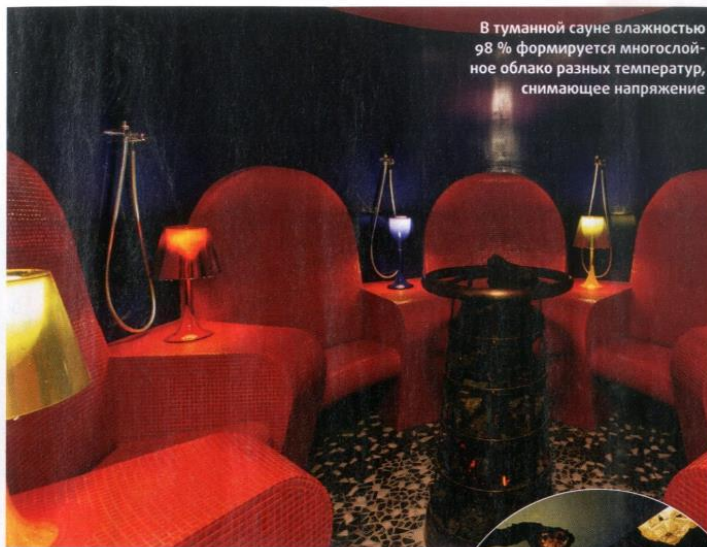
В туманной сауне влажностью 98 % формируется многослойное облако разных температур, снимающее напряжение

Благодаря столь серьезному подходу, некоторые гости Lefay Resort