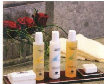
Основной ингредиент фирменной натуральной косметики Lefay Spa — оливковое масло