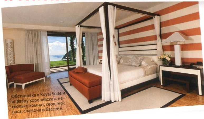
Обстановка в Royal Suite и вправду королевская: несколько комнат, своя терраса, спа-зона и бассейн.

В LEFAY SPA СОЗДАЛИ РЕДКИЙ СИМБИОЗ СЕМЕЙНОГО ОТДЫХА И ПРОГРАММ ОЗДОРОВЛЕНИЯ ОРГАНИЗМА.