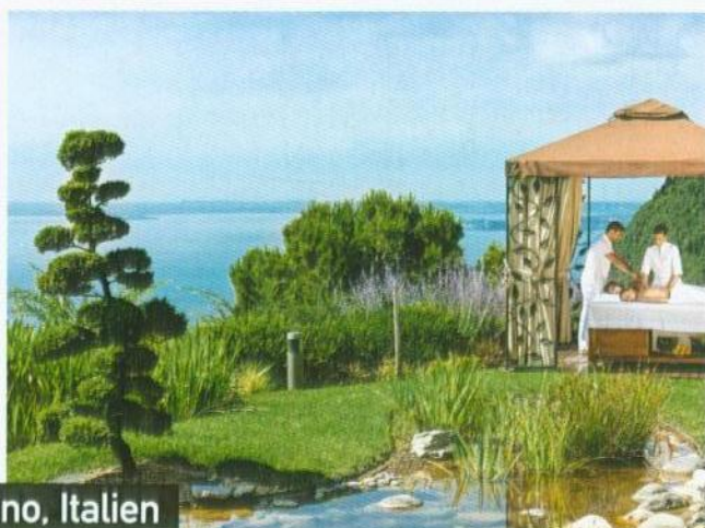
Lefay in Gargnano, Italien