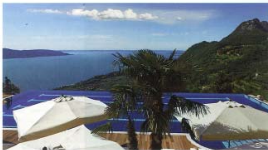
Das Resort bietet einen herrlichen Blick über den Gardasee.