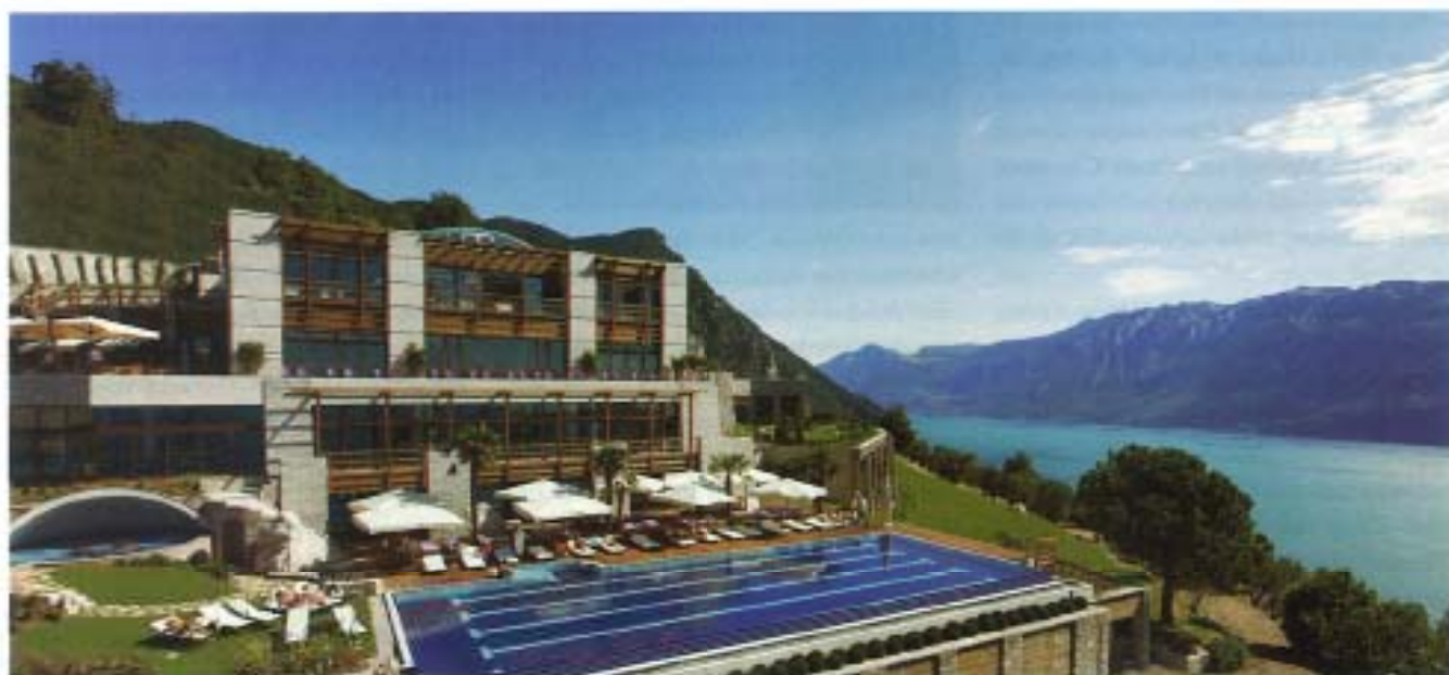
Lefay Resort & Spa Lago di Garda in Gargnano.

Das erste der geplanten Lefay-Resorts wurde vor Kurzem in Gargnano am Gardasee eröffnet. Mit ihren Resorts will die Familie Leali auf dem internationalen Markt eine neue Marke für qualitativ hochwertigen Wellness-Urlaub «Made in Italy» schaffen. Ein Vorhaben, das die oftmals etwas verstaubte italienische Wellness-Branche aufwirbeln dürfte.