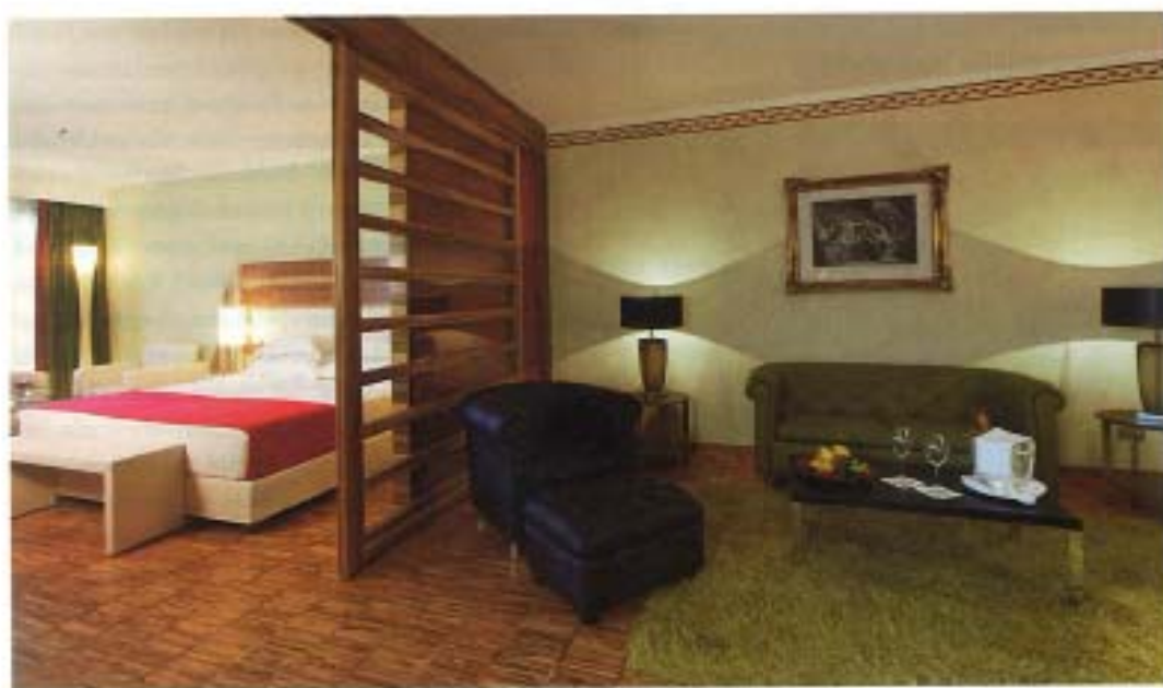
Alle Zimmer sind mit edlen Materialien ausgestattet.

Das Haus wurde sodann nach den Vorgaben des Umwelt-Zertifikats ISO 14001 erstellt, welche die Phase der «Planung architektonischer Lösung für innovative und umweltverträgliche Hotelanlagen» sicherstellen. Die Ausführungen des Baus erfolgten mit modernster Bautechnik, und das Haus wurde mit neuester Technologie sowie mit alternativen und erneuerbaren Energiequellen ausgestattet.