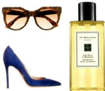
1. Солнцезащитные очки Gucci 2. Туфли Gianvito Rossi 3. Масло для души Lime Basil & Mandarin, Jo Malone

Когда (а точнее, если) вам захочется ступить к озеру, прогуляйтесь по Гарньяно, уютному прибрежному городку у подножия холма с красивыми палатками и старинными виллами и церквями. Загляните в лимонный сад La Malota к семье Giuseppe Gandossi, чтобы попробовать самый вкусный фруктовый джем и лимончелло ( www.gardafriends.com ). Для прогулки по озеру возьмите напрокат лодку.