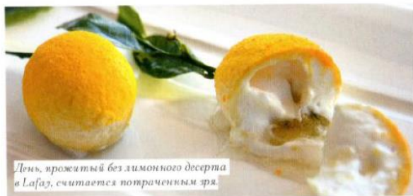
День, прожитый без лимонного десерта в Lefay, считается потраченным зря.