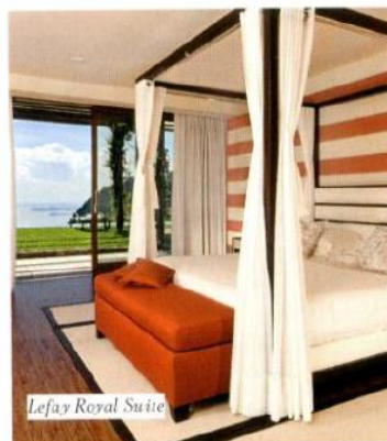
Lefay Royal Suite