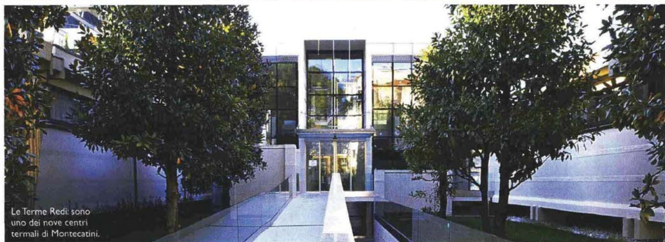
Le Terme Redi sono uno dei nove centri termali di Montecatini.