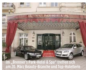
Im „Brenner's Park-Hotel & Spa“ treffen sich am 20. März Beauty-Branche und Top-Hotellerie

G enuss trifft Gesundheit: Das neue Schlüsselwort der Wellness-Branche heißt „Prävention“. Medizinische und ganzheitliche Spa-Konzepte gewinnen an Bedeutung, sie sollen dem stressigen Lifestyle entgegenwirken. Ärztliche Checks und Coachings gehen Hand in Hand mit klassischen Verwöhnprogrammen wie Massagen oder kosmetischen Behandlungen. Für die Pflegelinien gilt das Gleiche. Edelsteine werden dank neuer Technologien in Hightech-Texturen gebettet, traditionelles Heilwissen inspiriert Forscher auf der Suche nach neuen Wirkwundern. Die Branche ist in Bewegung – entsprechend groß war der Ansturm der Bewerber beim 14. GALA SPA AWARD. 121 Pflegelinien mit 316 Produkten gingen an den Start, zudem 152 Spa-Bewerbungen aus 24 Ländern. Getestet wurde von der renommierten Jury (siehe Kasten rechts). Gastgeber und Mit-Initiator des Showdowns in Baden-Baden ist am 20. März wieder das „Brenner's Park-Hotel & Spa“.