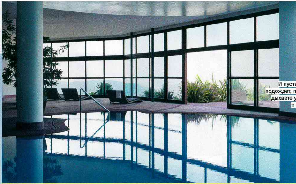
И пусть весь мир подождет, пока вы отдыхаете у бассейна в Lefay SPA!