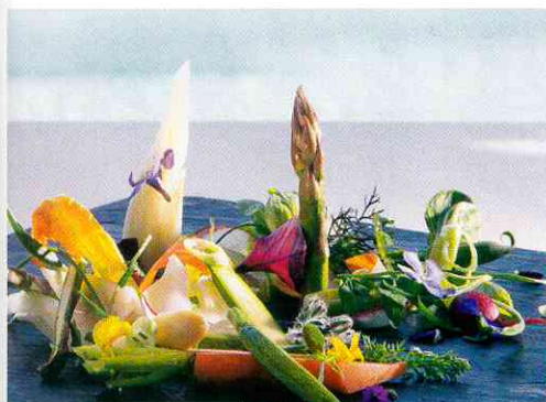
Блюда в ресторанах готовятся строго из местных сезонных продуктов

еще один день над Гардой. И здесь как раз тот самый случай, когда лучше один раз увидеть, чем сто прочитать! Впрочем, ровно то же самое справедливо и в отношении самого Lefay Resort & SPA Lago di Garda. ©