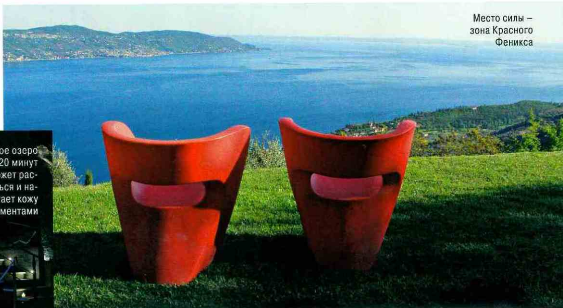
Место силы – зона Красного Феникса

Соляное озеро всего за 20 минут поможет расслабиться и напитает кожу микроэлементами