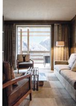
Pacchetto completo. Da sinistra, una sezione dello spa di Santa Maria del Lefay Resort & Spa Dolomiti, oltre alle due suite dell'hotel. Il resort propone in vendita 23 residenze con servizi all inclusive a partire da 1.800.000 €. Accanto, un dettaglio del living. Nella pagina accanto, in basso, il ponte del Willy Lure, uno degli yacht gestiti da Floating Life. Accanto, un dettaglio del garage di Toplife Concierge, a Chianciano, una Jaguar E-Type durante uno degli eventi Pure Drivers, organizzati da Toplife Concierge per i suoi clienti.